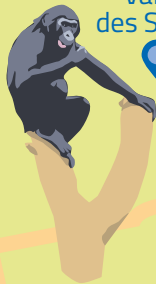
Vallée des Singes

Ruffec Nanteuil-en-Vallée Vers Angoulême