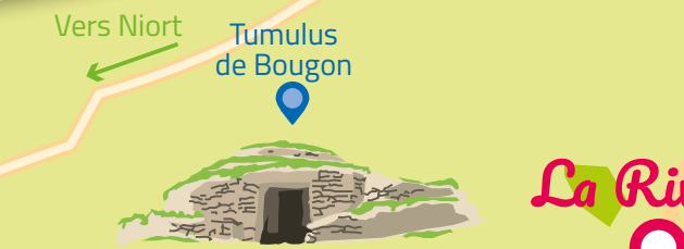
Vers Niort Tumulus de Bougon