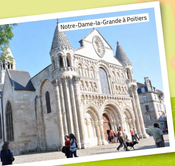
Notre-Dame-la-Grande à Poitiers

Ruffec Nanteuil-en-Vallée Vers Angoulême