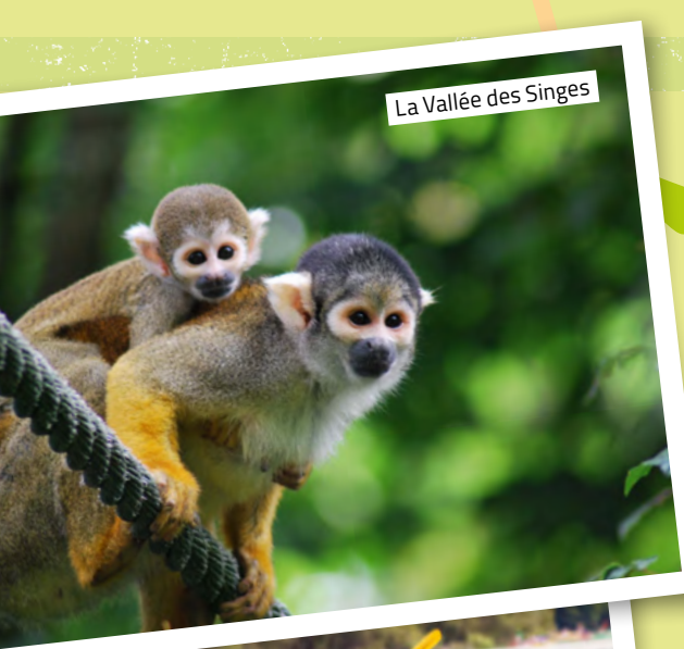
La Vallée des Singes