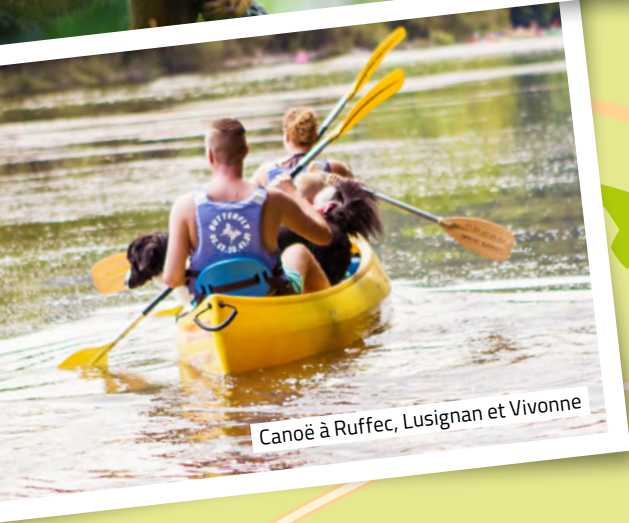
Canoë à Ruffec, Lusignan et Vivonne