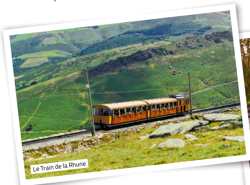
Le Train de la Rhune

À Bayonne , dégustez son célèbre jambon et son succulent chocolat ! Amateurs de saveurs pimentées, émerveillez-vous devant les maisons à colombages d' Espelette , ornées de piments rouges séchés. Un régal pour les yeux ! Pour le dessert, le Pastis landais , brioche tendre parfumée à la vanille, au rhum, à l'anis ou à la fleur d'oranger, ravira vos papilles !