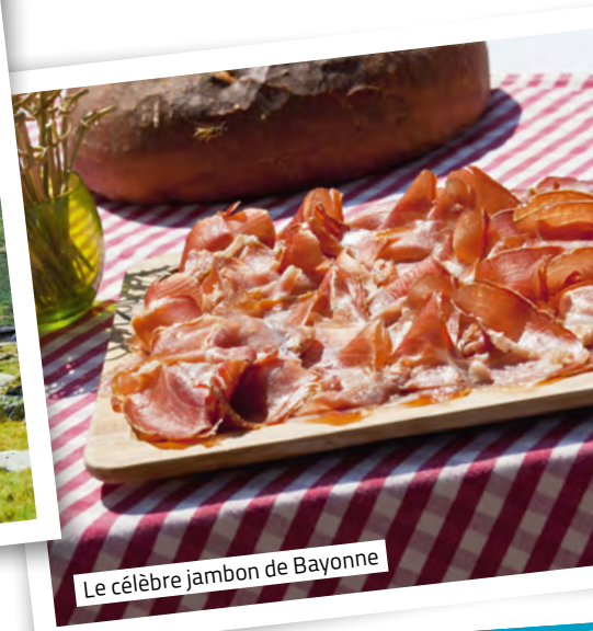
Le célèbre jambon de Bayonne