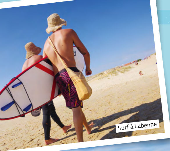
Surf à Labenne