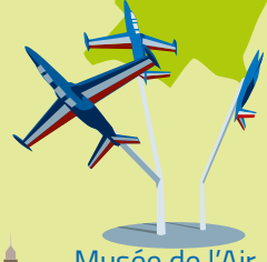
Musée de l'Air et de l'Espace