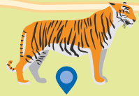
Zoo du Bois d'Attilly