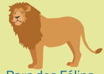
Parc des Félines