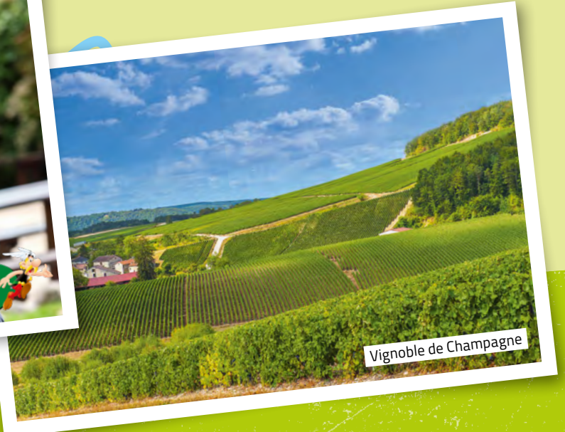
Vignoble de Champagne