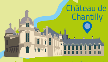
Château de Chantilly

Parc naturel régional Oise - Pays de France