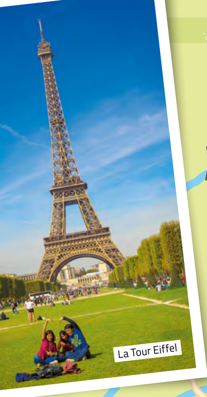
La Tour Eiffel