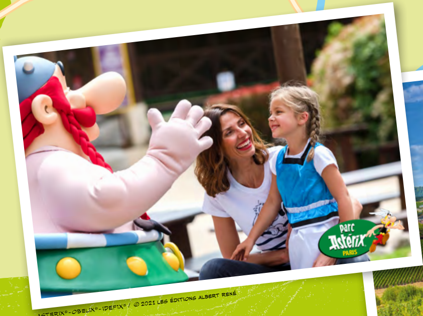
Parc Astérix Paris