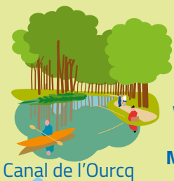
Canal de l'Ourcq