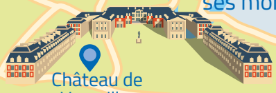
Château de Versailles