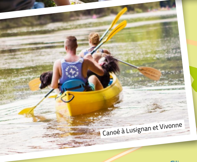
Canoë à Lusignan et Vivonne