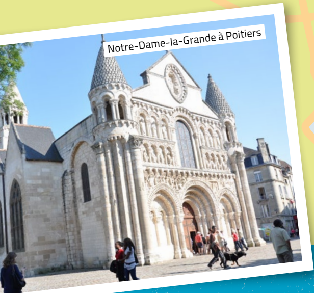
Notre-Dame-la-Grande à Poitiers