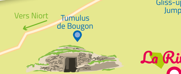
Vers Niort Tumulus de Bougon