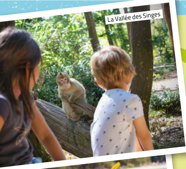
La Vallée des Singes