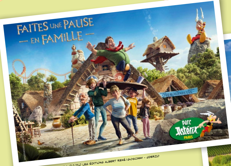
ASTERIX®-OBELIX®-IDEFIX® / © 2020 LES ÉDITIONS ALBERT RENÉ/GOSCINNY - UBERZO