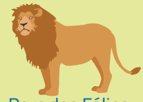
Parc des Félines