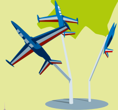
Musée de l'Air et de l'Espace