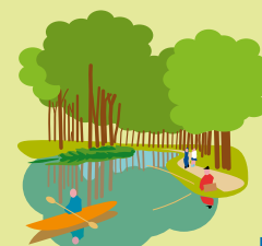
Canal de l'Ourcq