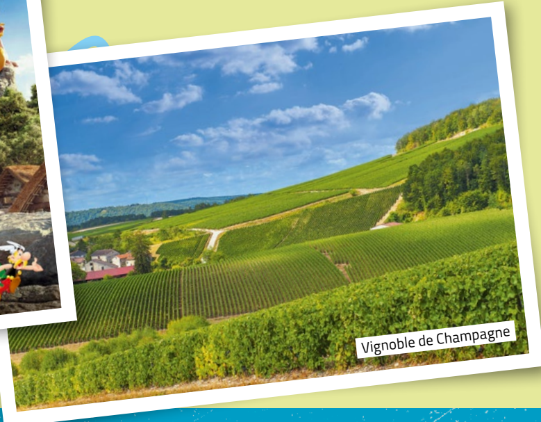
Vignoble de Champagne